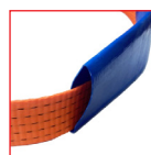
DETALLE PROTECTOR* SOBRE PEDIDO