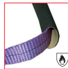
DETALLE PROTECTOR* SOBRE PEDIDO