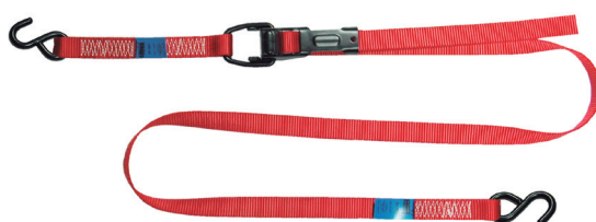
Ref. PTC-2C (Opcional)