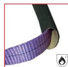
DETALHE DE PROTEÇÃO* A PEDIDO