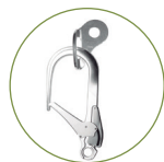
DETALLE MOS-267 Apertura 110mm