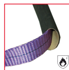
DETALLE PROTECTOR* SOBRE PÉDIDO